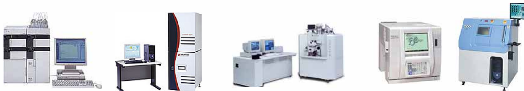
汎用分析(クロマト,光,質量,熱 等)