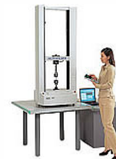
試験計測・環境計測