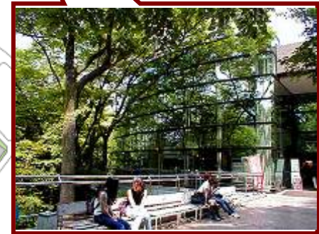
大隈ガーデンハウス (懇親会会場)