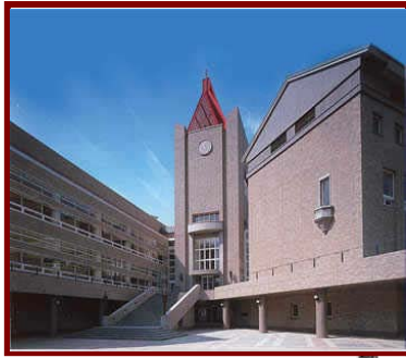
総合学術情報センター 国際会議場